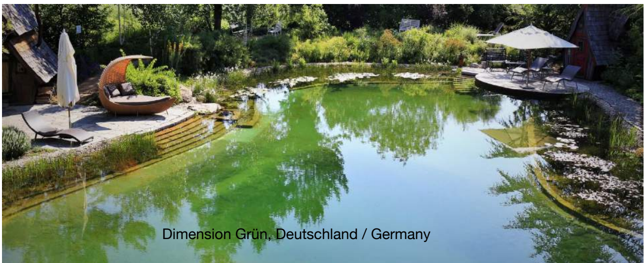
Dimension Grün, Deutschland / Germany

Die Nominierten in der Kategorie Schwimmteich privat The nominees in the category swimming pond private