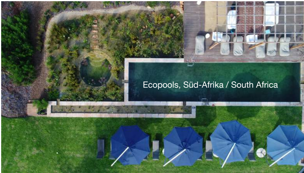
Ecopools, Süd-Afrika / South Africa

Schwimmteich touristische Nutzung Swimming pond touristic use